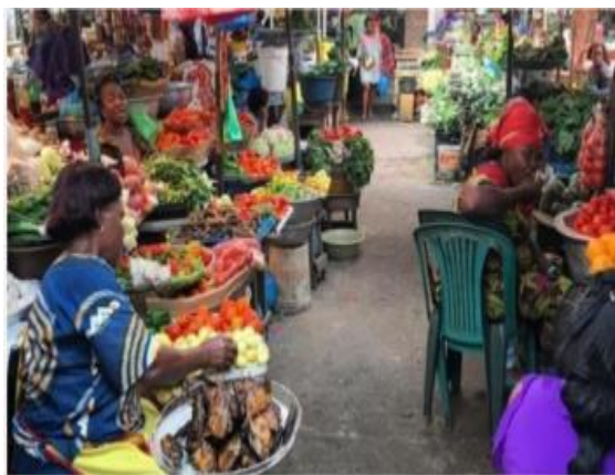
Document 1 : Au marché